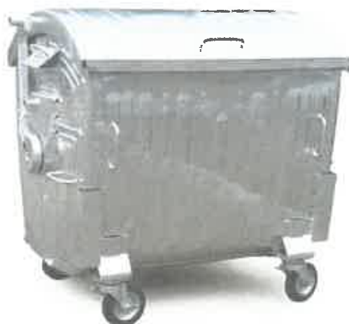
Zdj. 2 przykład kontenera ze stali ocynkowanej

Pojemniki powinny być wykonane z czystej i doskonale odtuszczonej blachy stalowej, po zespawaniu korpusu pojemnika i pokrywy ocynkowane ogniowo. Kółka skrętne sterowane pojedynczo, gumowe obręcze kół.