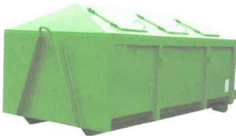
Zdj.3 przykład kontenera typ KP- 7 zamknięty