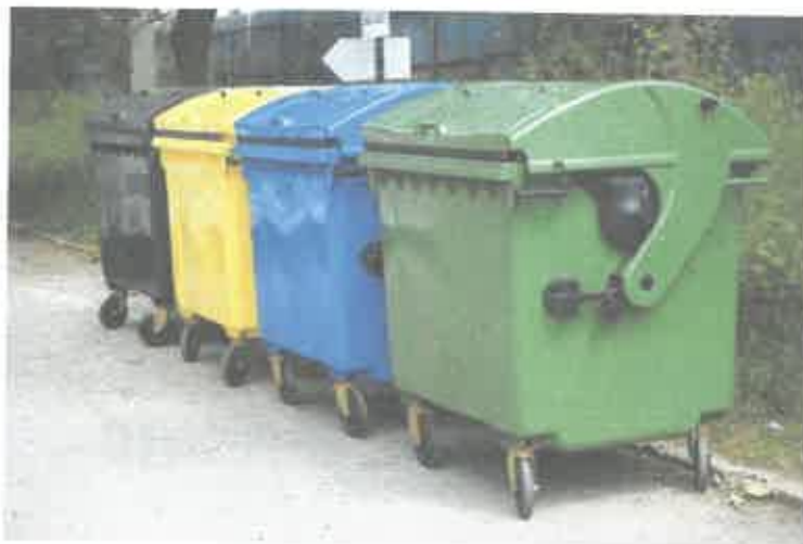
Zdj. 1 przykład kontenerów z tworzywa sztucznego.

b) 2szt. kontenerów wykonanych ze stali ocynkowanej z przeznaczeniem na: