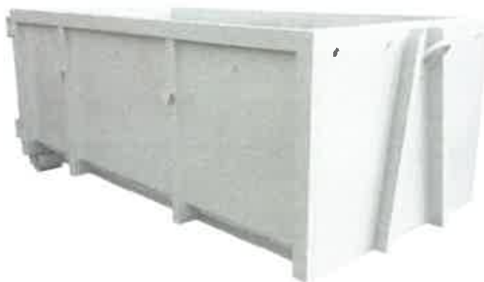
Zdj.4 przykład kontenera typ KP-7 otwarty